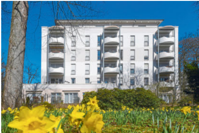
Die schönste Fassade einer Gewerbeimmobilie.